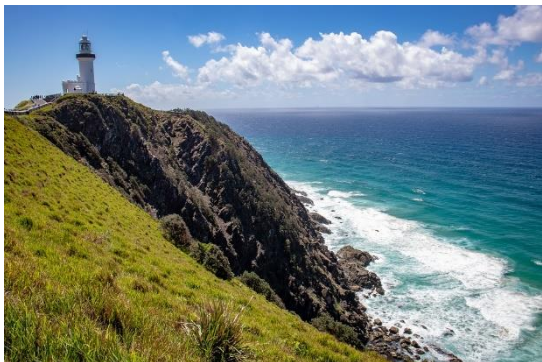
Mys Cape Byron (Austrálie)

NEJSEVERNĚJŠÍ NEJJIŽNĚJŠÍ NEJZÁPADNĚJŠÍ NEJVÝCHODNĚJŠÍ