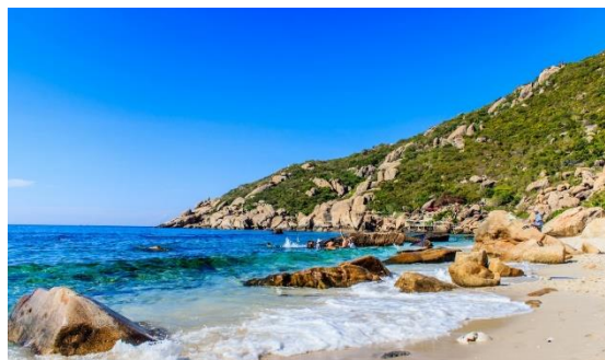
Mys Baba (Turecko)

NEJSEVERNĚJŠÍ NEJJIŽNĚJŠÍ NEJZÁPADNĚJŠÍ NEJVÝCHODNĚJŠÍ