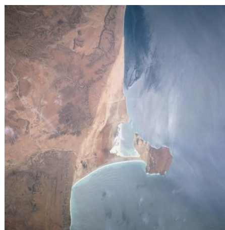
mys Hafun (Somálsko)