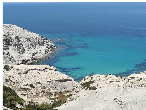
Bílý mys – Cap Blanc (Tunisko)