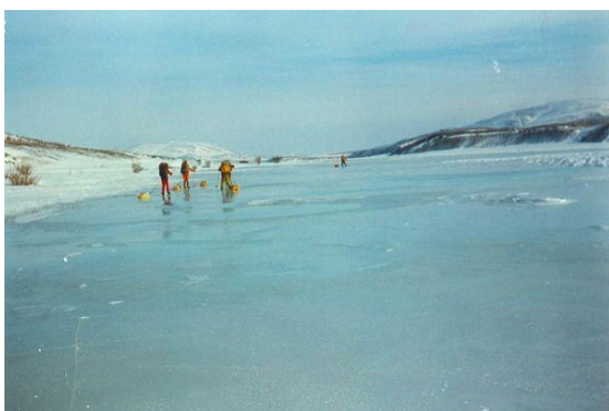
ústí řeky Bajdaraky do Bajdarackého zálivu (Karské moře, Rusko)

NEJSEVERNĚJŠÍ NEJJIŽNĚJŠÍ NEJZÁPADNĚJŠÍ NEJVÝCHODNĚJŠÍ