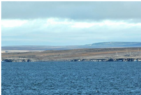
Čeljuskinův mys (Rusko)