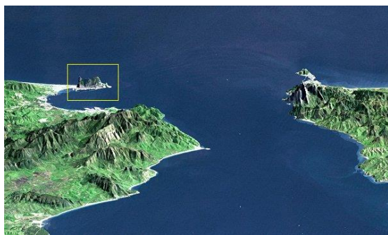
mys Marroqui (Španělsko)