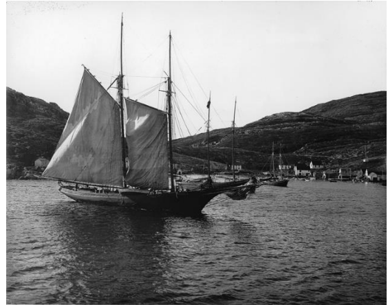
Mys Cape Charles (Kanada)

NEJSEVERNĚJŠÍ NEJJIŽNĚJŠÍ NEJZÁPADNĚJŠÍ NEJVÝCHODNĚJŠÍ