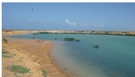
mys Punta Gallinas (Kolumbie)