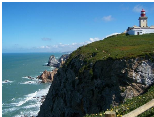
mys Roca (Portugalsko)