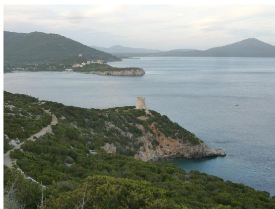
Mys Tanjung Buru (Malaisie)