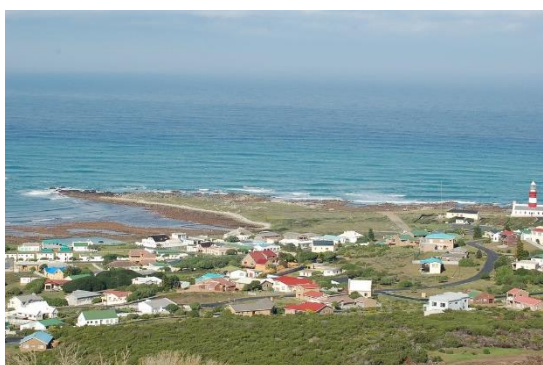
Střelkový mys (JAR)