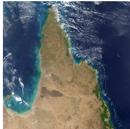
Yorský mys (Austrálie)