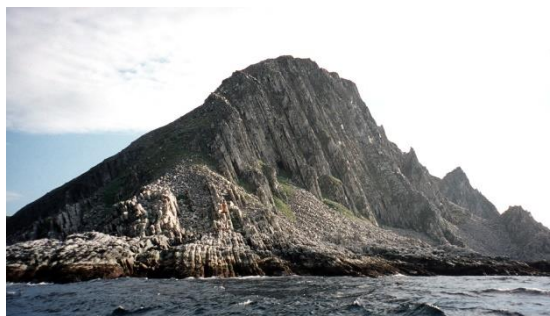
Mys Nordkinn (Norsko)