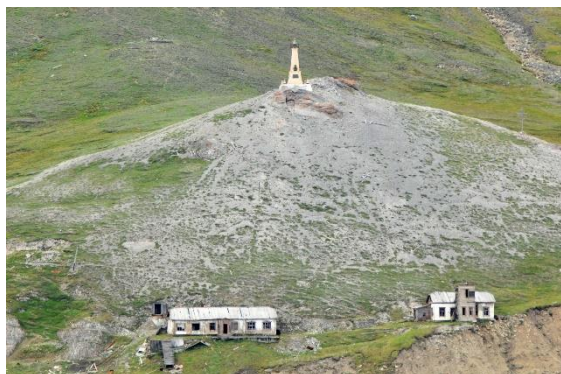
Děžnevův mys (Rusko)