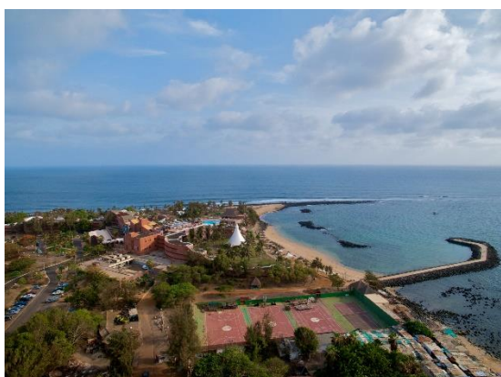
mys Pointe des Almadies (Senegal)