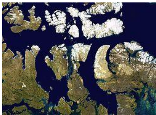
Mys Cape Murchison (Kanada)