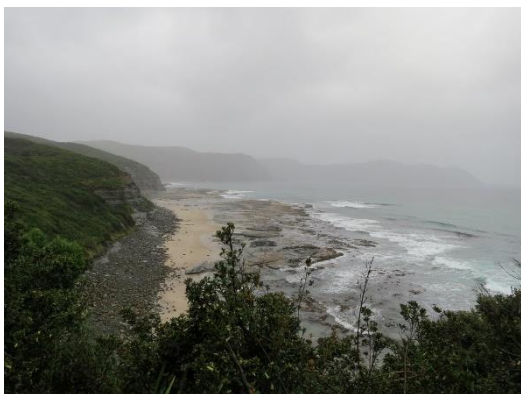
Mys South-East point (Tasmánie)