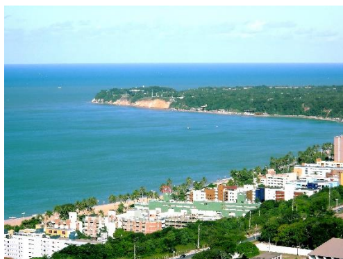
Mys Cabo Branco (Brazílie)

NEJSEVERNĚJŠÍ NEJJIŽNĚJŠÍ NEJZÁPADNĚJŠÍ NEJVÝCHODNĚJŠÍ