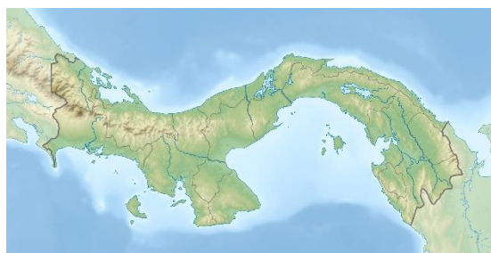
Mys Punta Mariato (Panama)