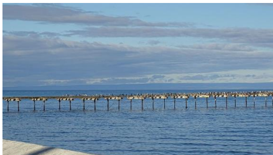
Mys Cabo Froward (Chile)