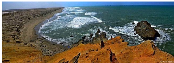
Mys Punta Pariñas (Peru)